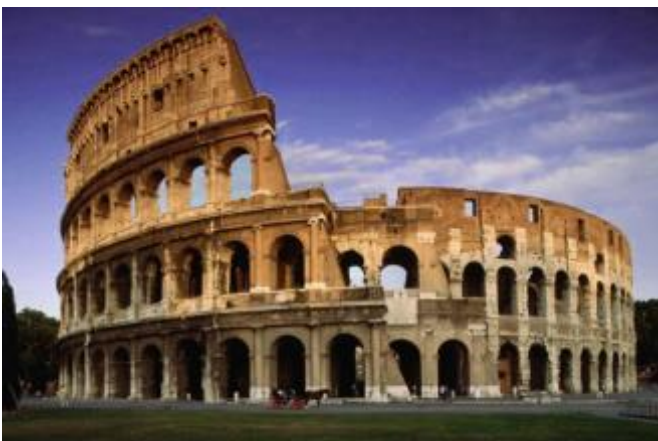
Fig.1 Puntuación máxima: 2 puntos

Analiza y comenta las dos obras de arte presentadas: