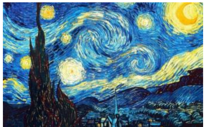
Fig.2 Puntuación máxima: 2 puntos