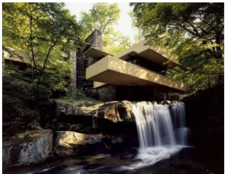
Fig.2 Puntuación máxima: 2 puntos